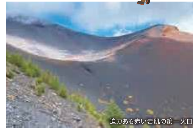
迫力ある赤い岩肌の第一火口